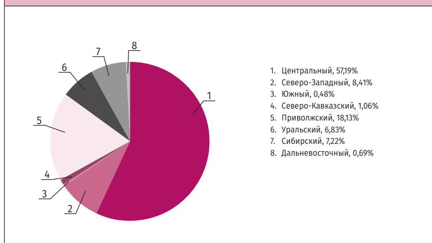
РИСУНОК 1. Структура выпуска лекарственных препаратов по федеральным округам

Необходимо отметить, что увеличение производства отмечалось во всех федеральных округах, выпускающих эту продукцию, и наибольший прирост – в Северо-Западном. При этом спад производства наблюдался только в Дальневосточном федеральном округе. Объем выпуска лекарственных препаратов по сравнению с предыдущим годом в данном